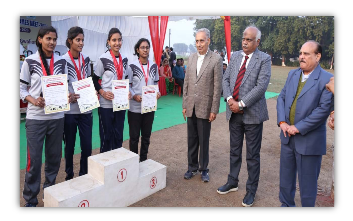
College of Agriculture, Indore