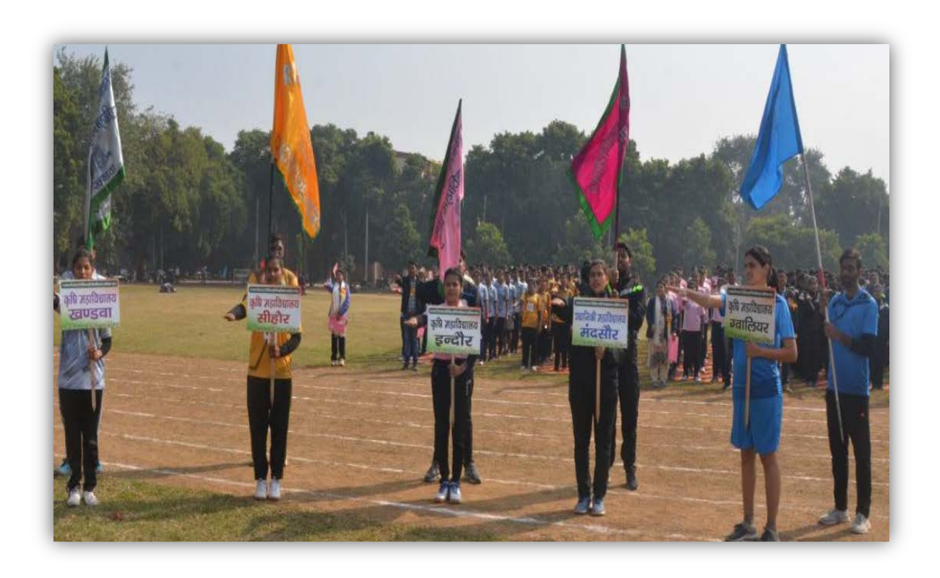
100mt.Race ( Women ) Participants of Gwalior, Indore , Khandwa, Mandsaur , Sehore