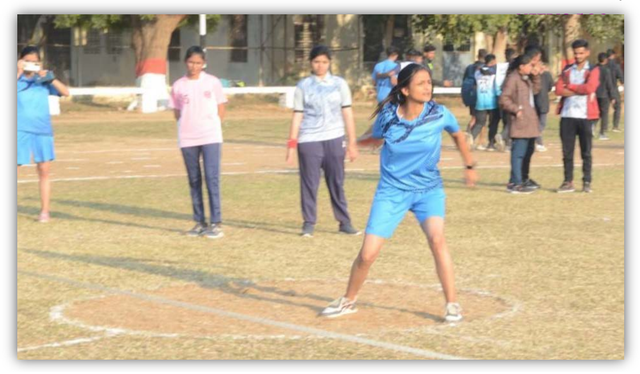
Discus Throw (Women) College of Agriculture Khandwa Team