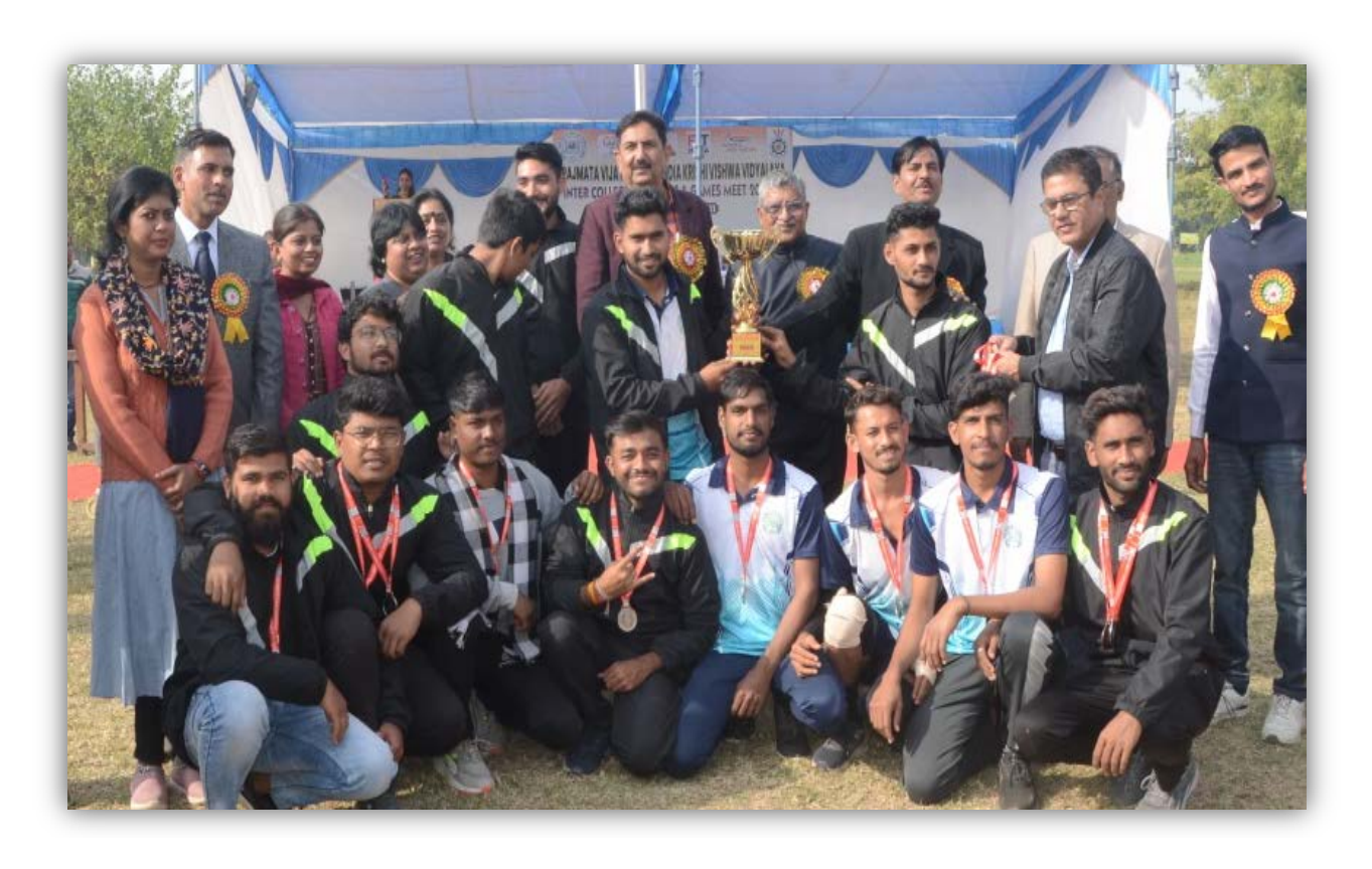
College of Agriculture, Indore Team