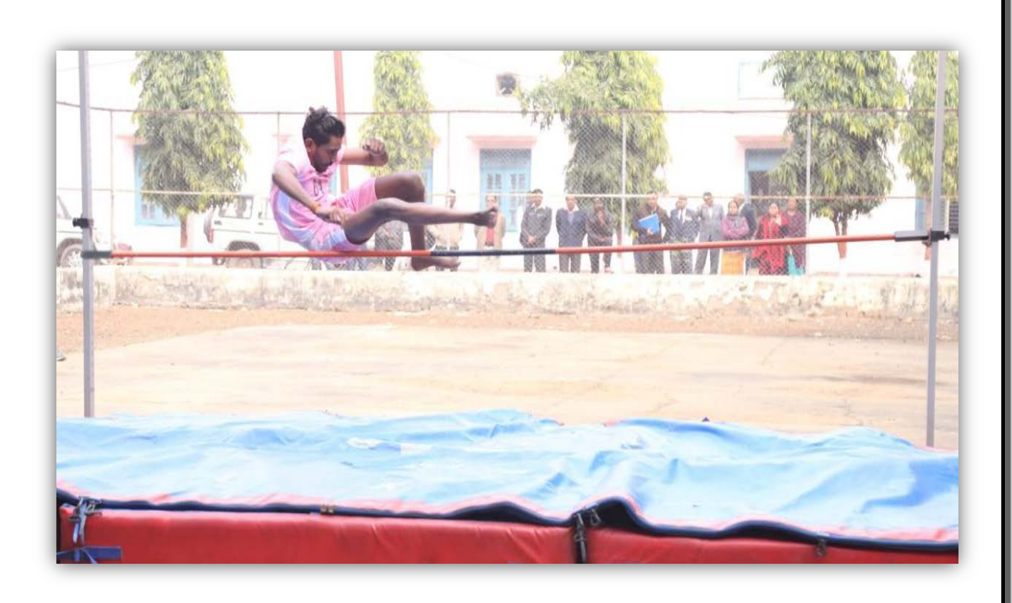
High Jump Event College of Agriculture, Gwalior