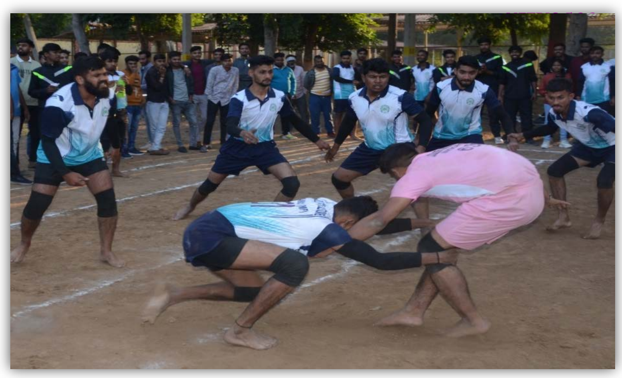
Kabaddi Team College of Agriculture ,Indore and College of Horticulture, Mandsaur