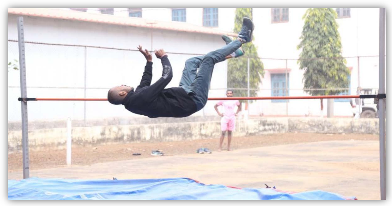
High Jump Event College of Agriculture, Indore