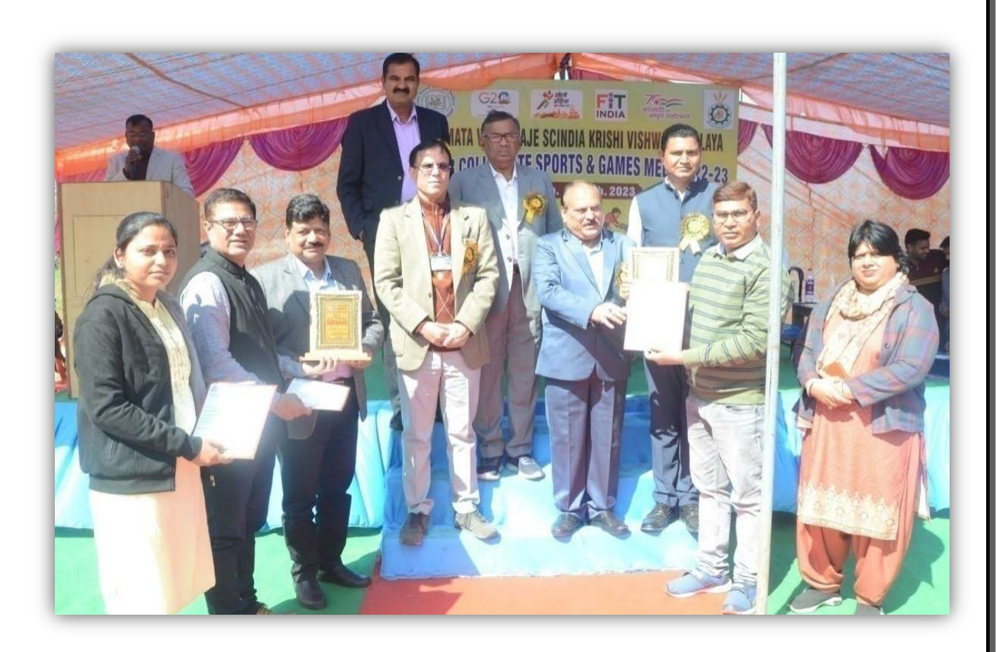
College of Agriculture, Sehore