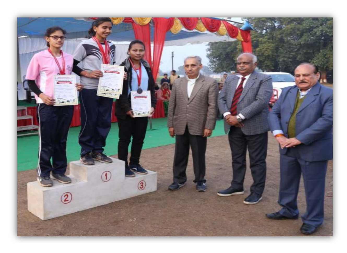
College of Agriculture, Gwalior