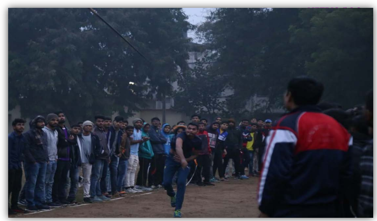
Javelin throw Events College of Agriculture, Indore