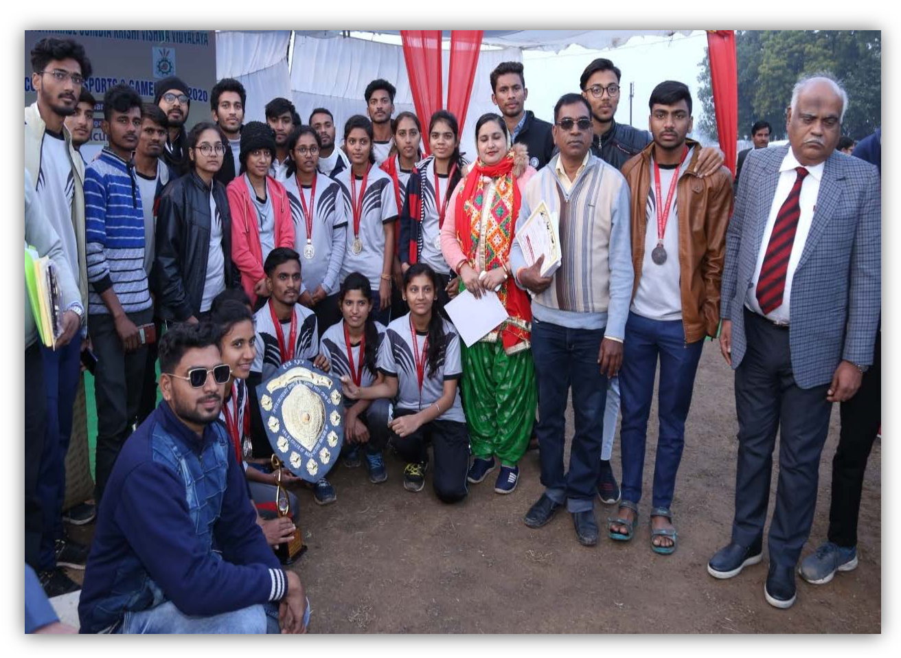
Closing Ceremony of Sports & Games Meet 2019-20