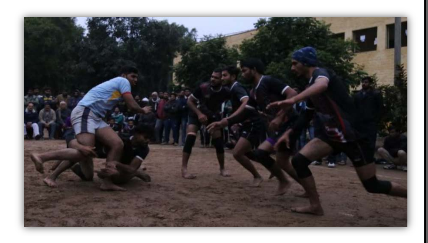
Kabaddi Team College of Agriculture, Gwalior & Indore