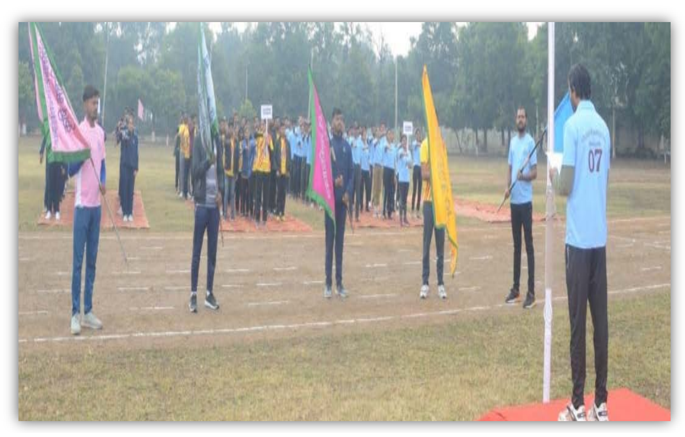
100mt.Race (Men) College of Gwalior, Indore, Khandwa, Sehore and College of Horticulture Mandsaur Teams