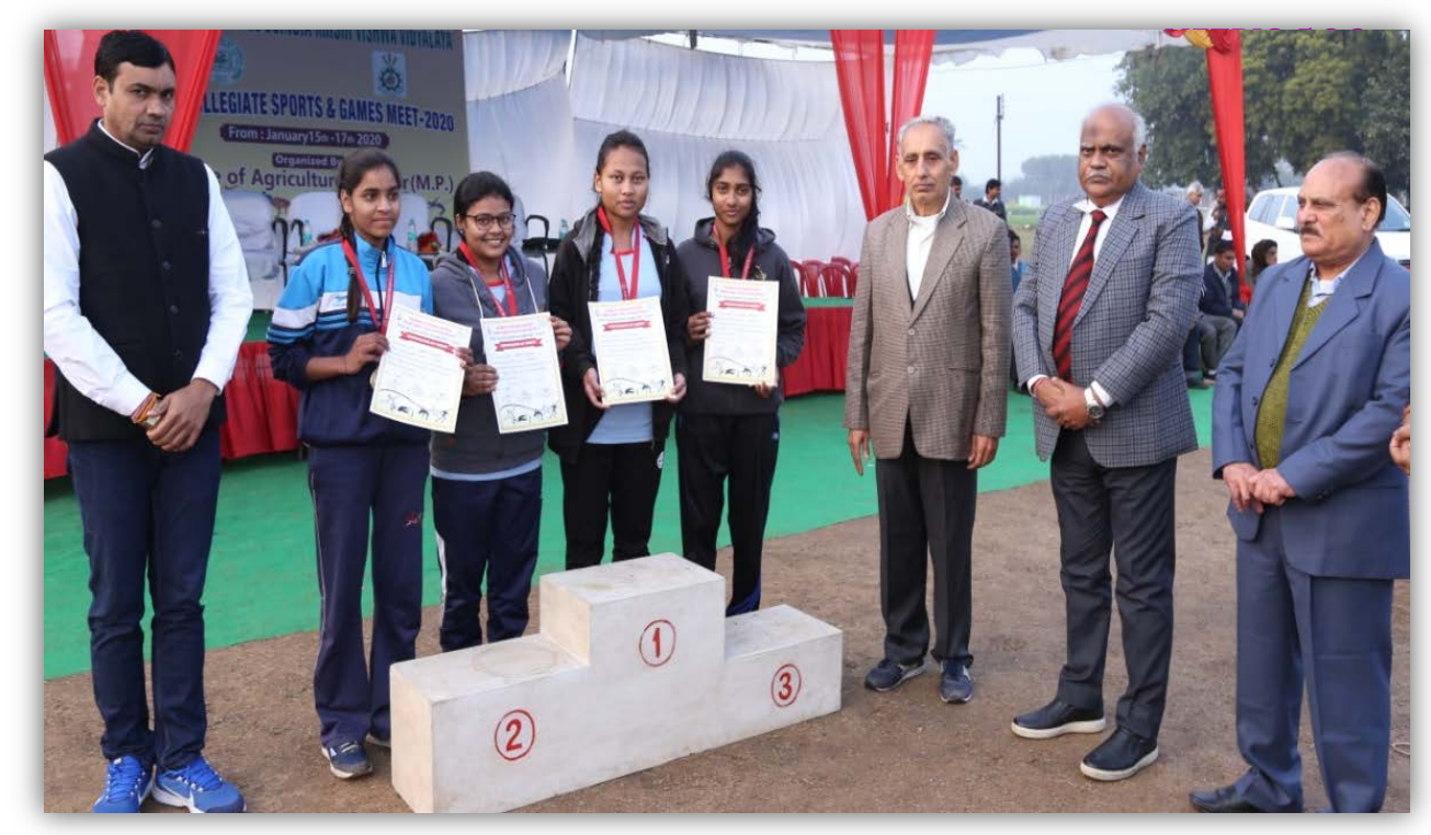
College of Agriculture, Khandwa