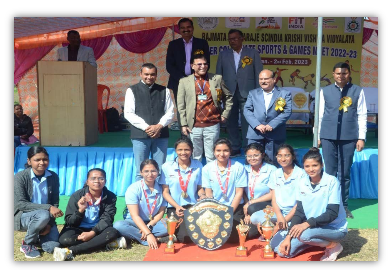
College of Agriculture, Gwalior