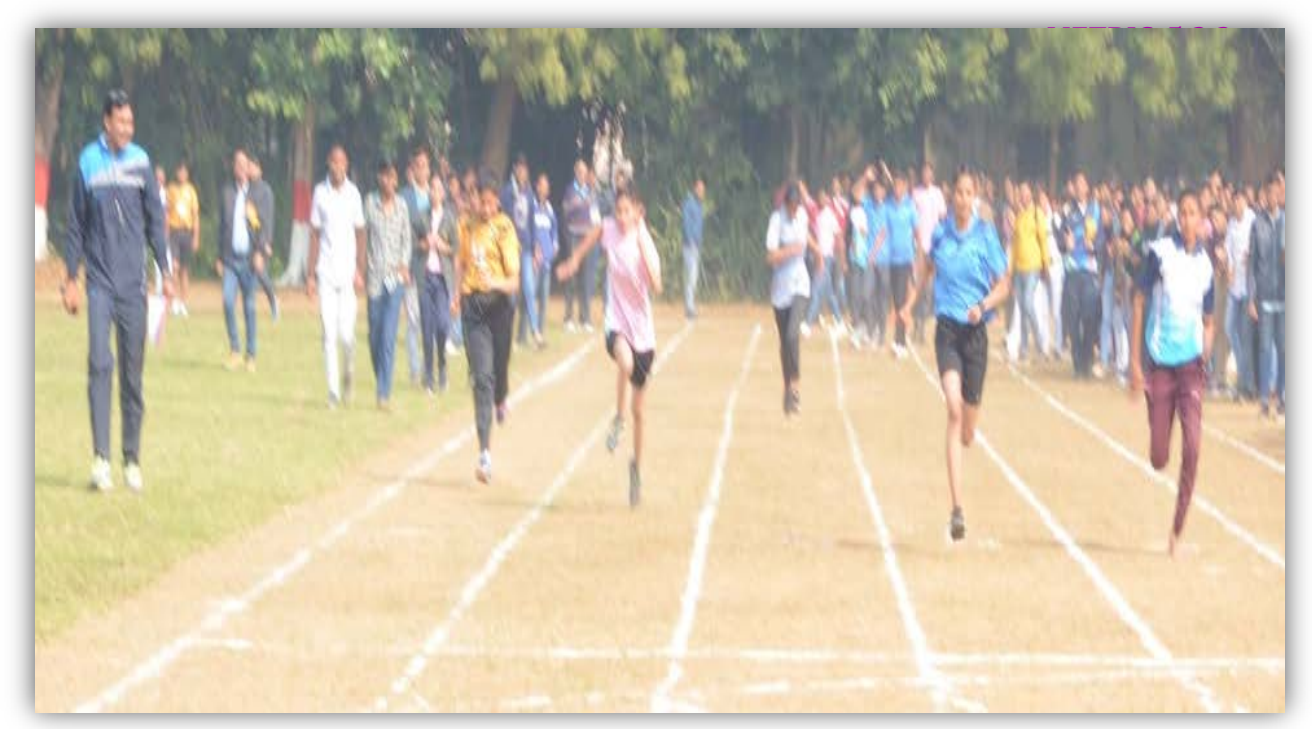
100mt.Race (Men) Teams from Gwalior, Indore, Khandwa, Mandsaur, Sehore