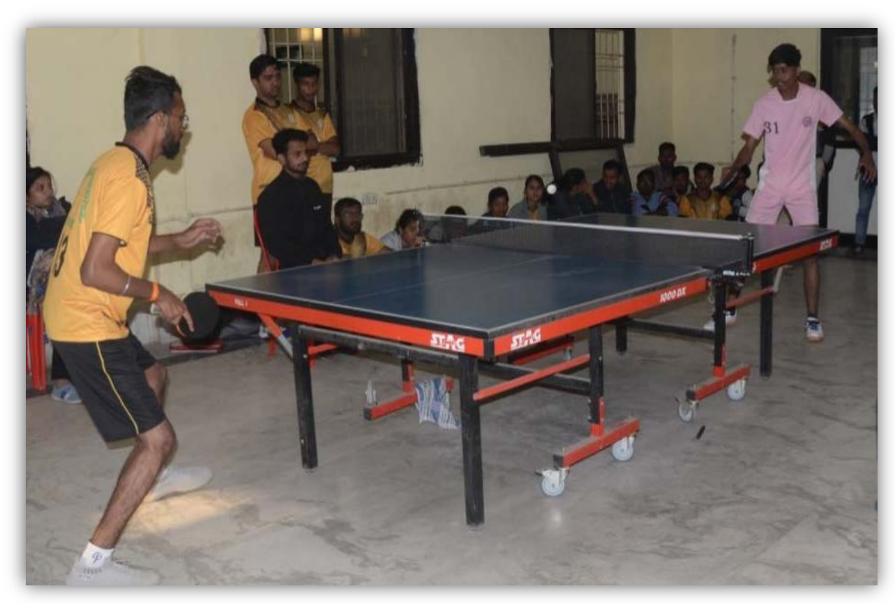
Victory Function Sports & Games Meet- 2023-24