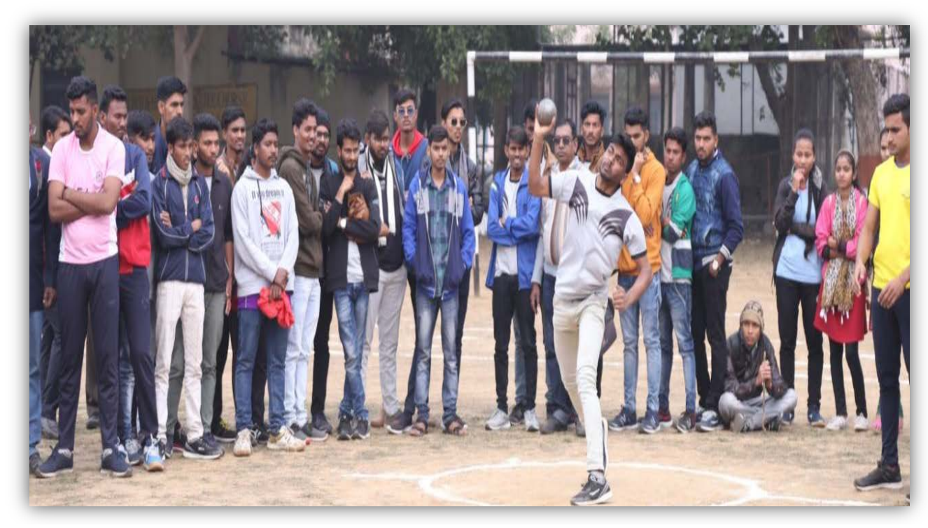
Javelin throw Events College of Agriculture, Gwalior