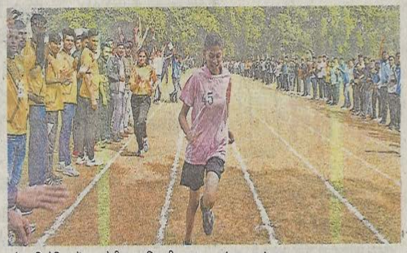
दौड प्रतियोगिता में भाग लेती एक प्रतिभागी धावक।

100 मीटर दौड कृषि विश्वविद्यालय की अंतर महाविद्यालयीन खेलकृद प्रतियोगिता के दूसरे दिन पदक के लिए छात्र खिलाडियों ने बहाया पसीना