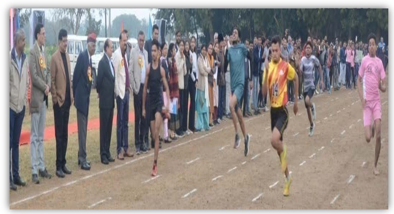
100mt.Race ( Women ) College of Gwalior, Indore , Khandwa, Sehore and College of Horticulture Mandsaur Teams