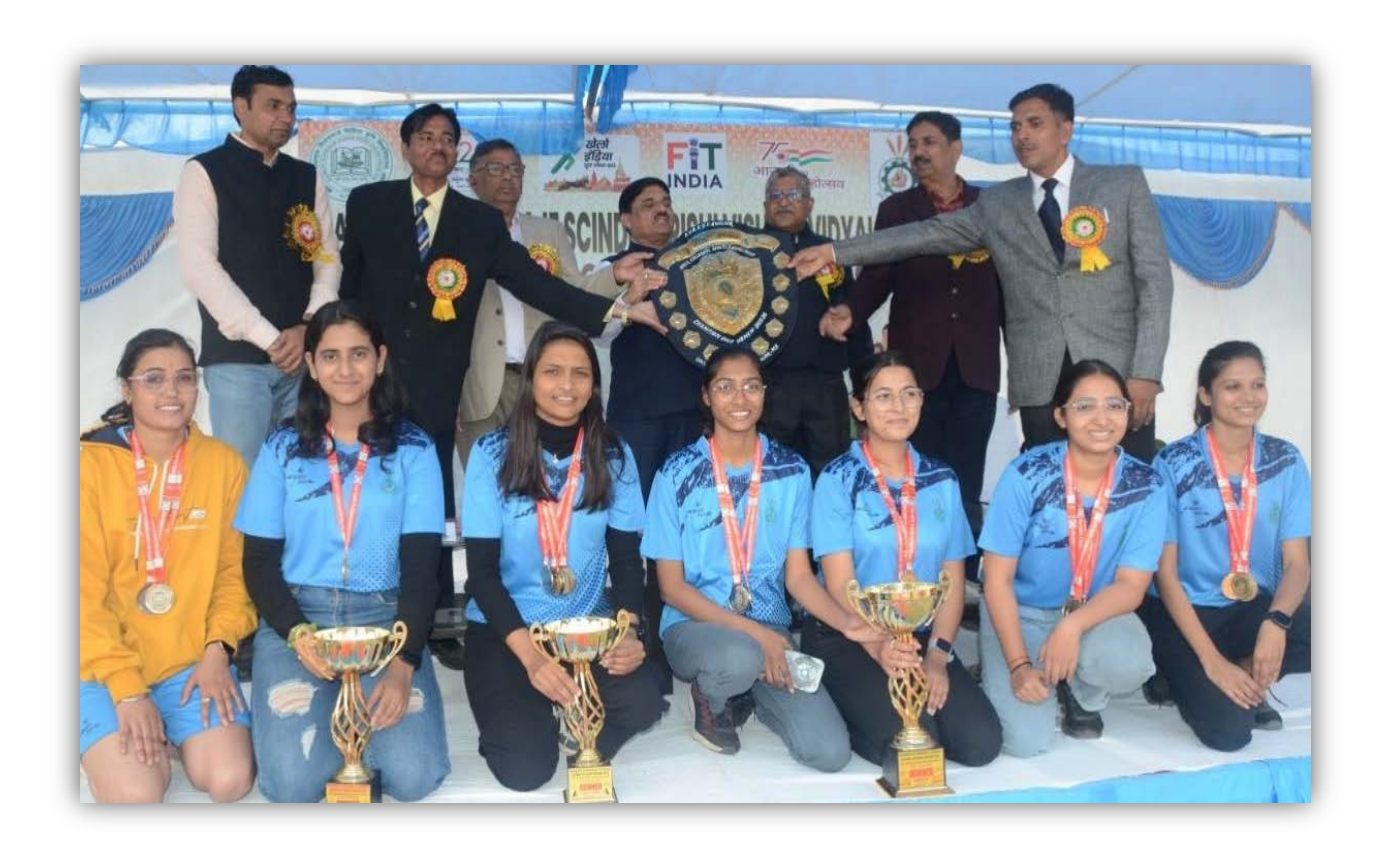
College of Agriculture, Sehore Team