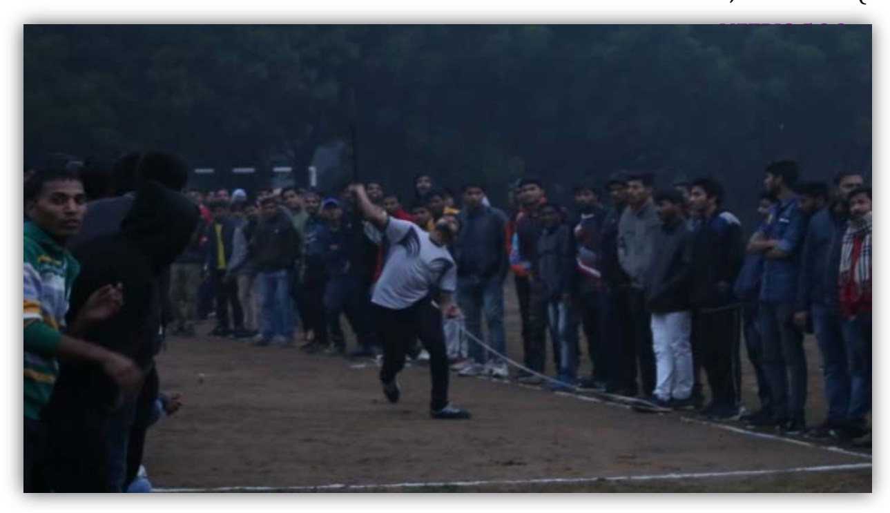
Javelin throw Events College of Agriculture, Sehore