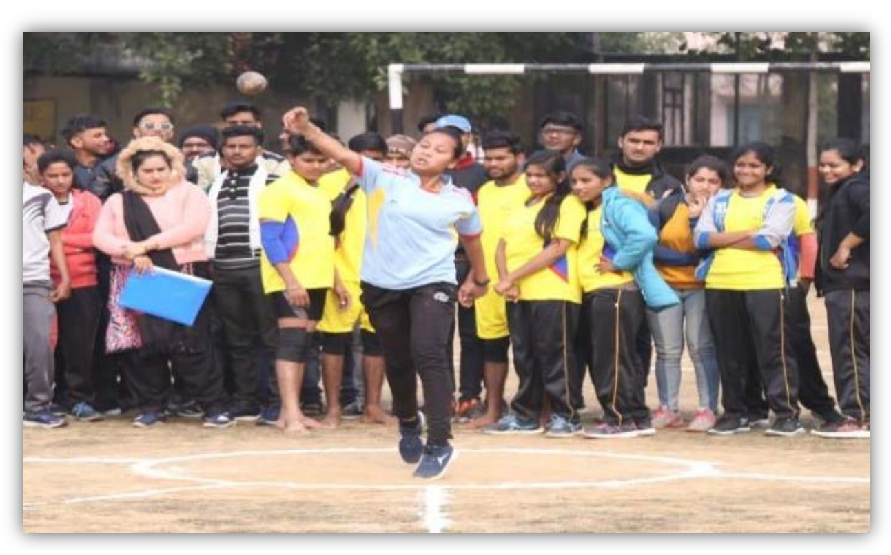
Shot Put Event (women) College of Agriculture, Sehore