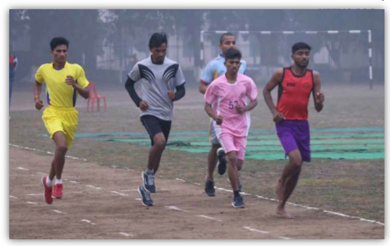
400mt.Race ( Women ) College of Gwalior, Indore , Khandwa, Mandsaur , Sehore Teams