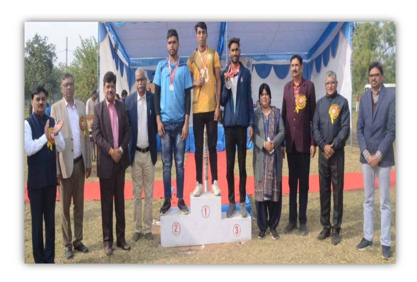
Closing Ceremony of Sports & Games Meet 2023-24