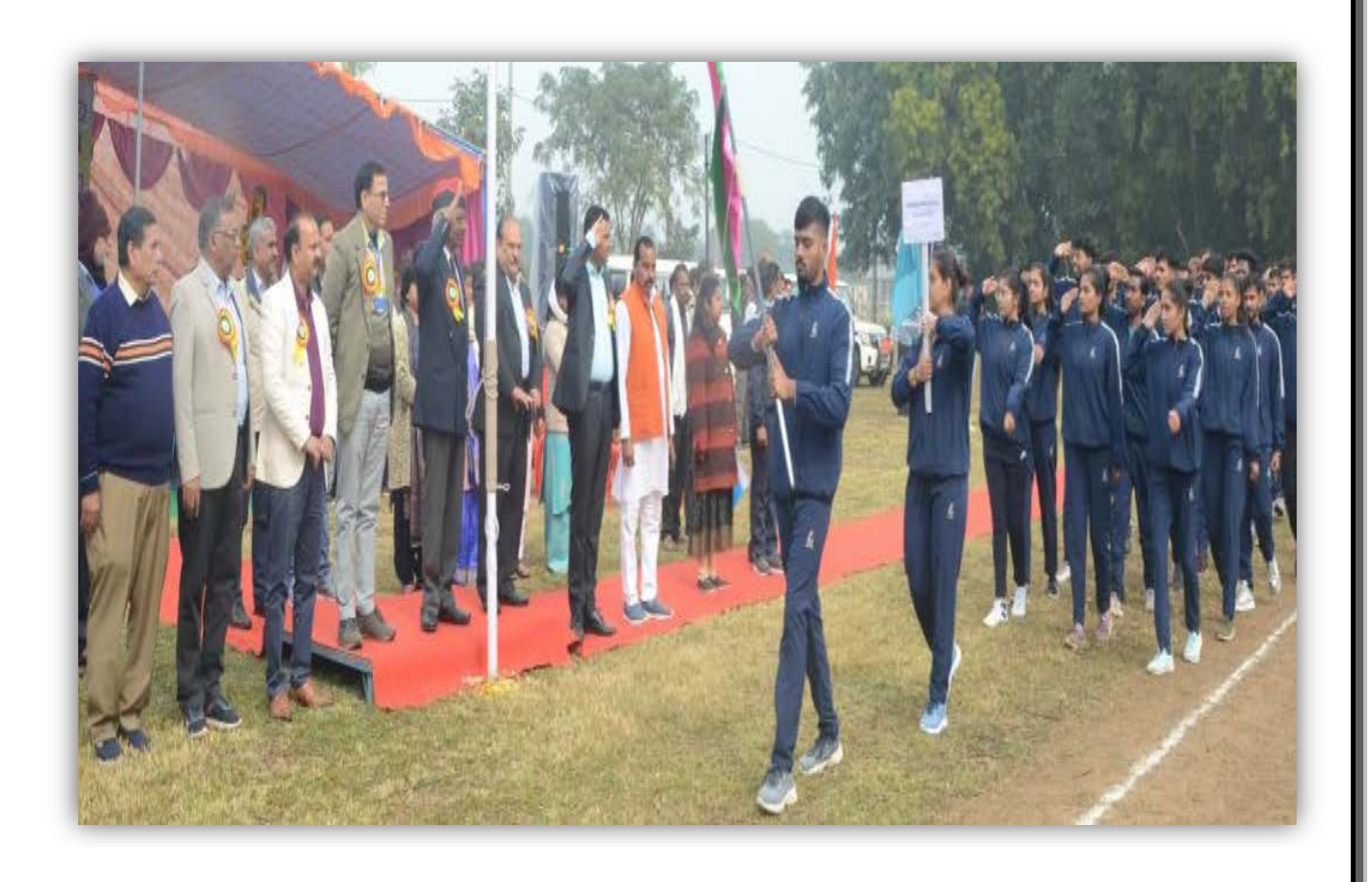
College of Agriculture, Indore, Khandwa, , Sehore, Gwalior and College of Horticulture Mandsaur Team