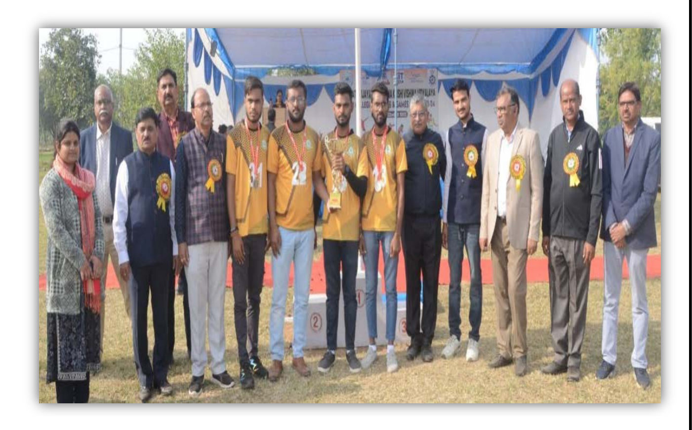
Over all Champion Award win by College of Agriculture, Gwalior