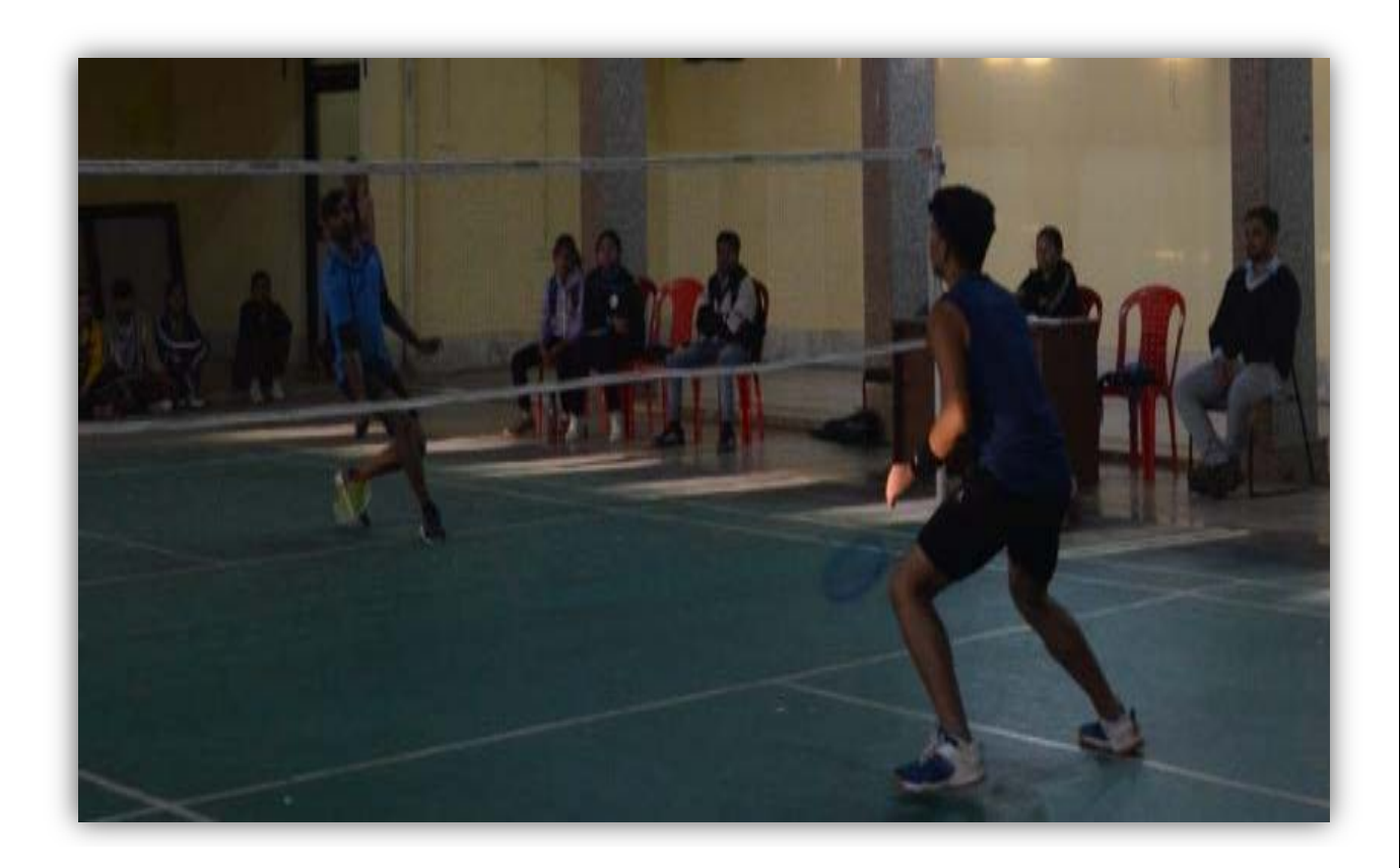
Table Tennis Team College of Agriculture - Sehore & Indore