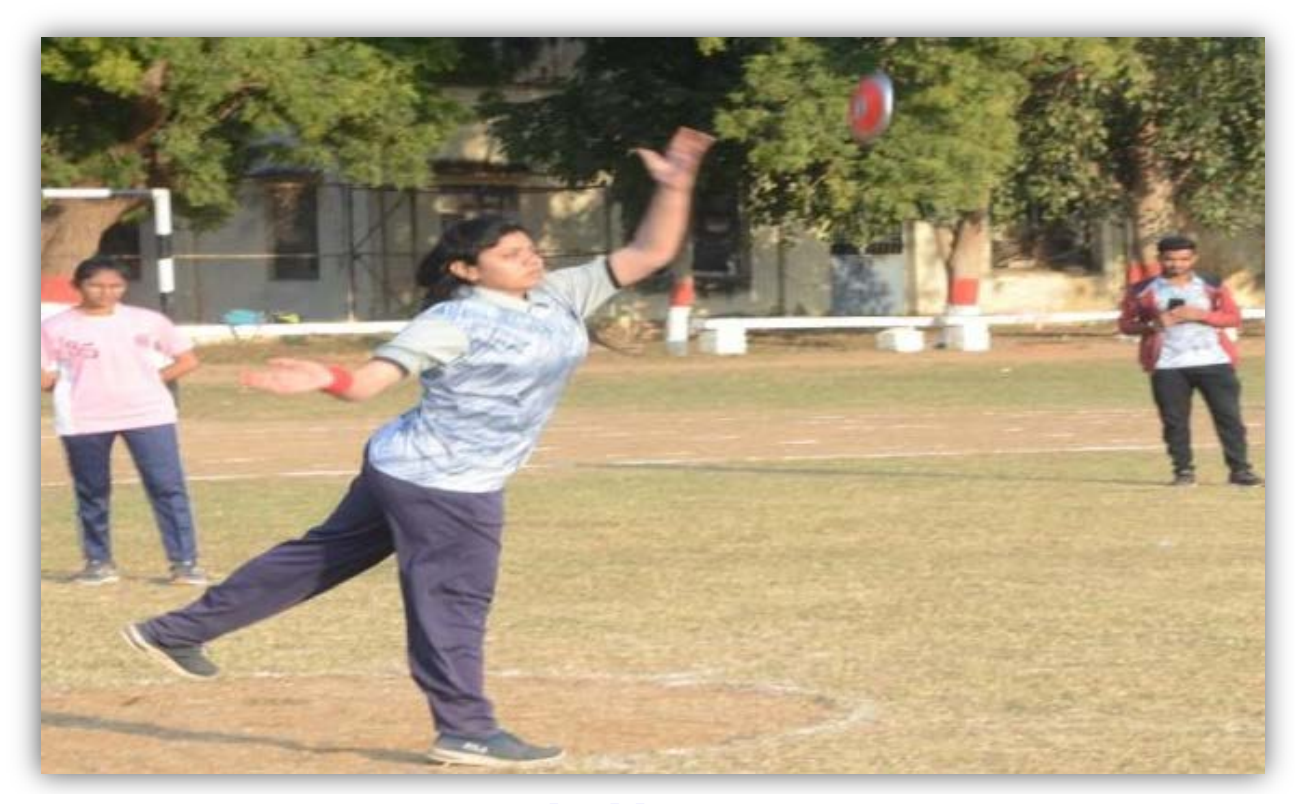
Kabaddi Team College of Agriculture, Indore and College of Horticulture, Mandsaur