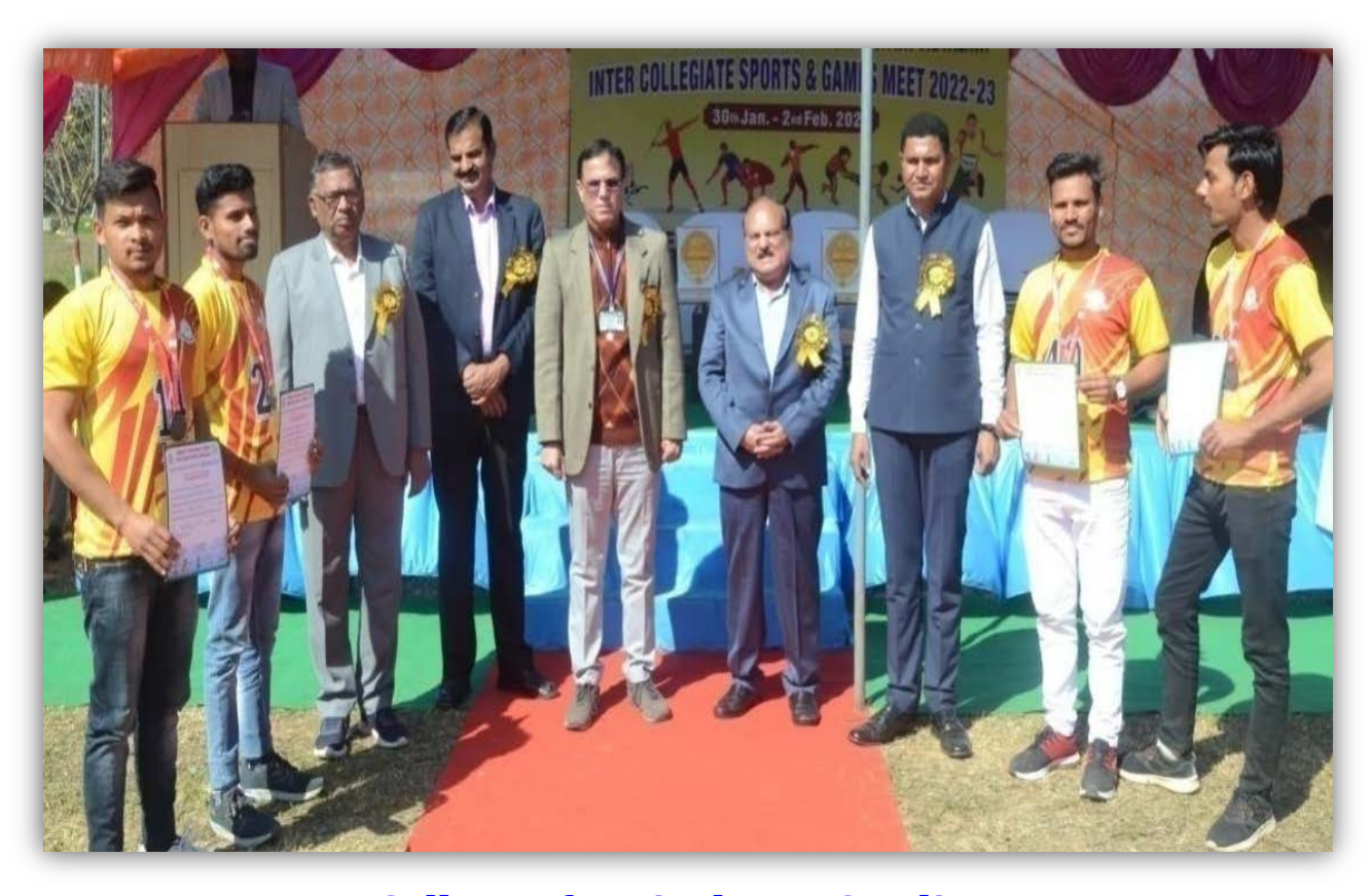
College of Agriculture, Gwalior