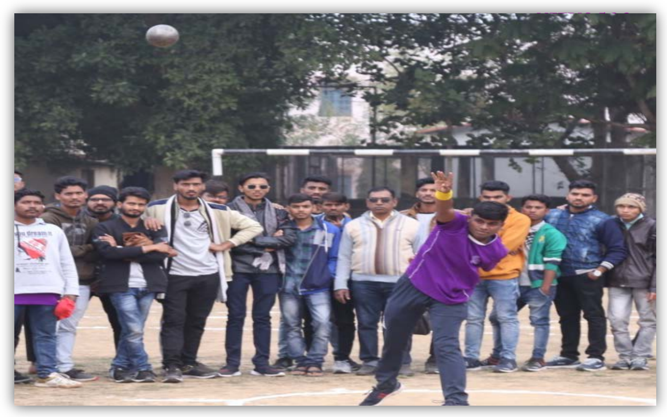
Shot Put Event (Men) College of Agriculture, Khandwa