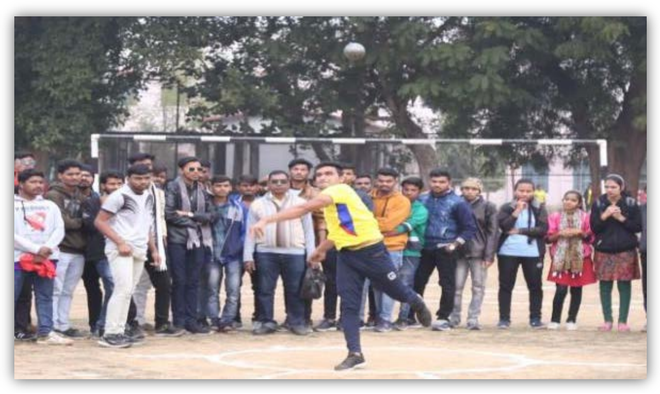
Shot Put Event (Men) College of Agriculture, Mandsaur