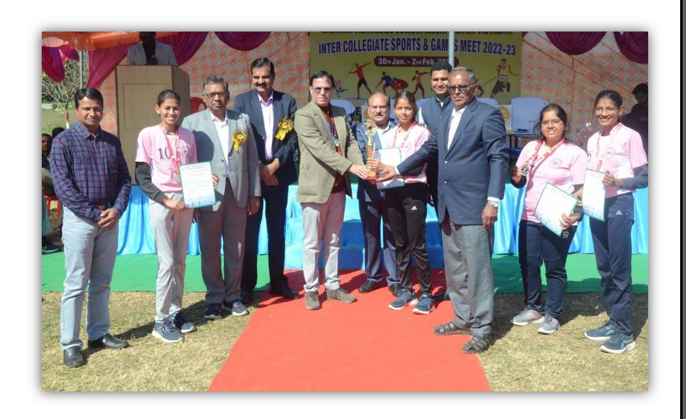
College of Horticulture, Mandsaur Team