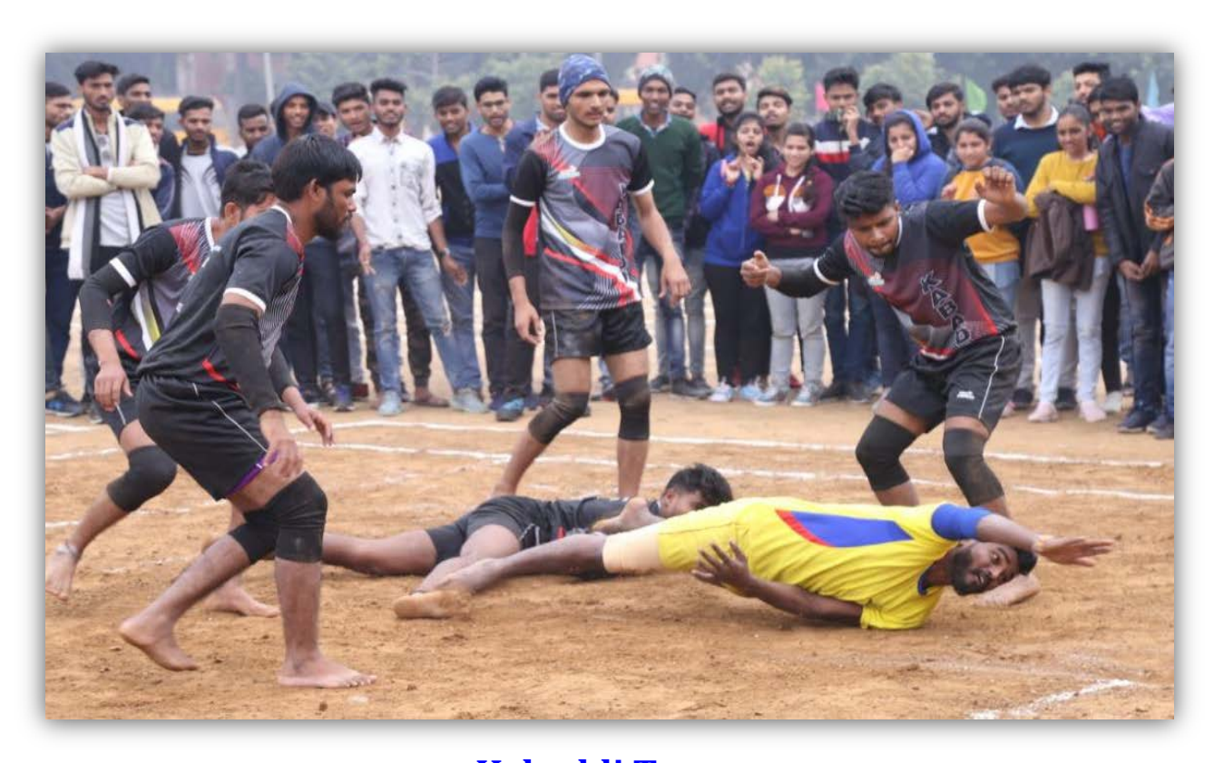
Kabaddi Team College of Agriculture/Hort. Gwalior & Mandsaur