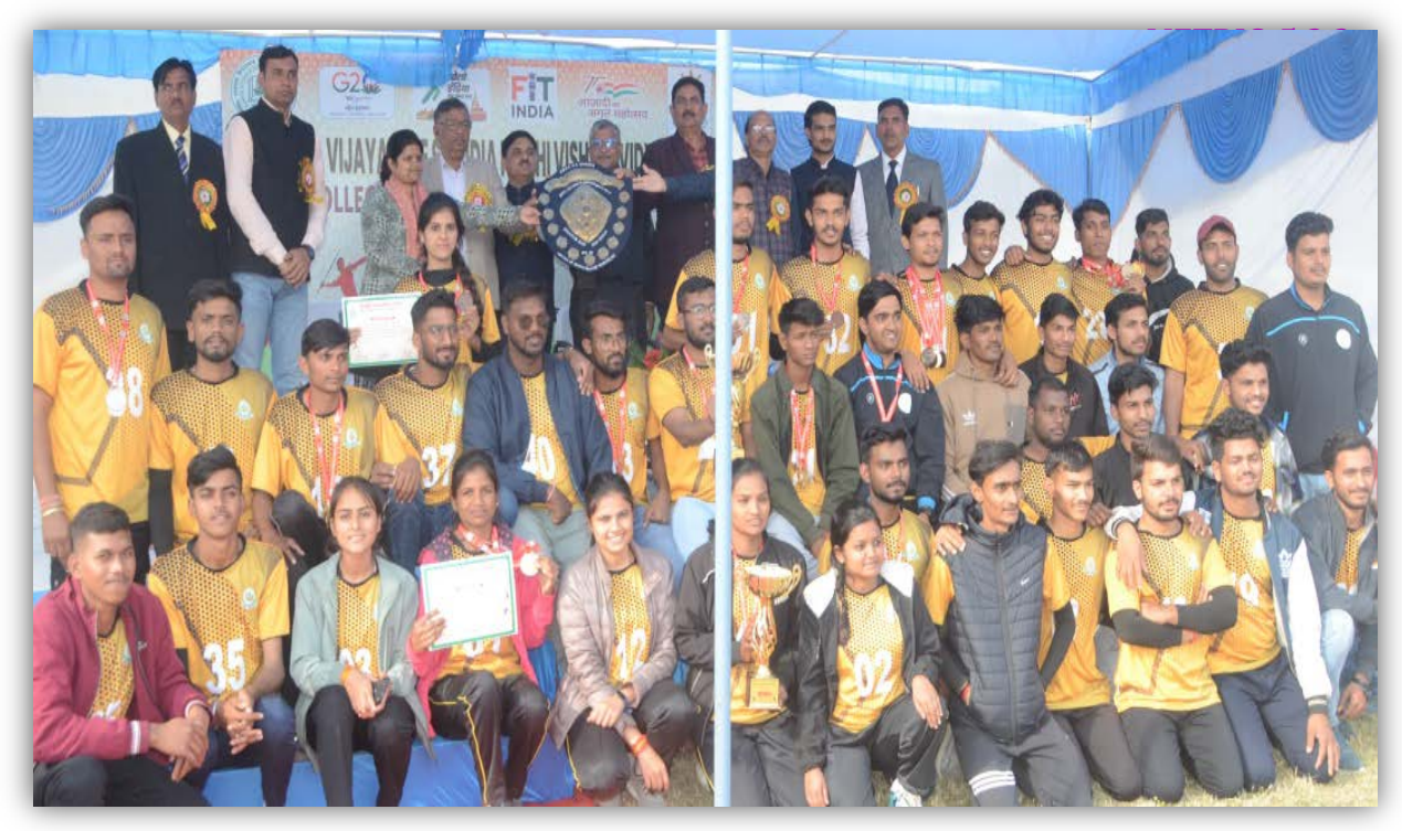
College of Horticulture, Mandsaur Team