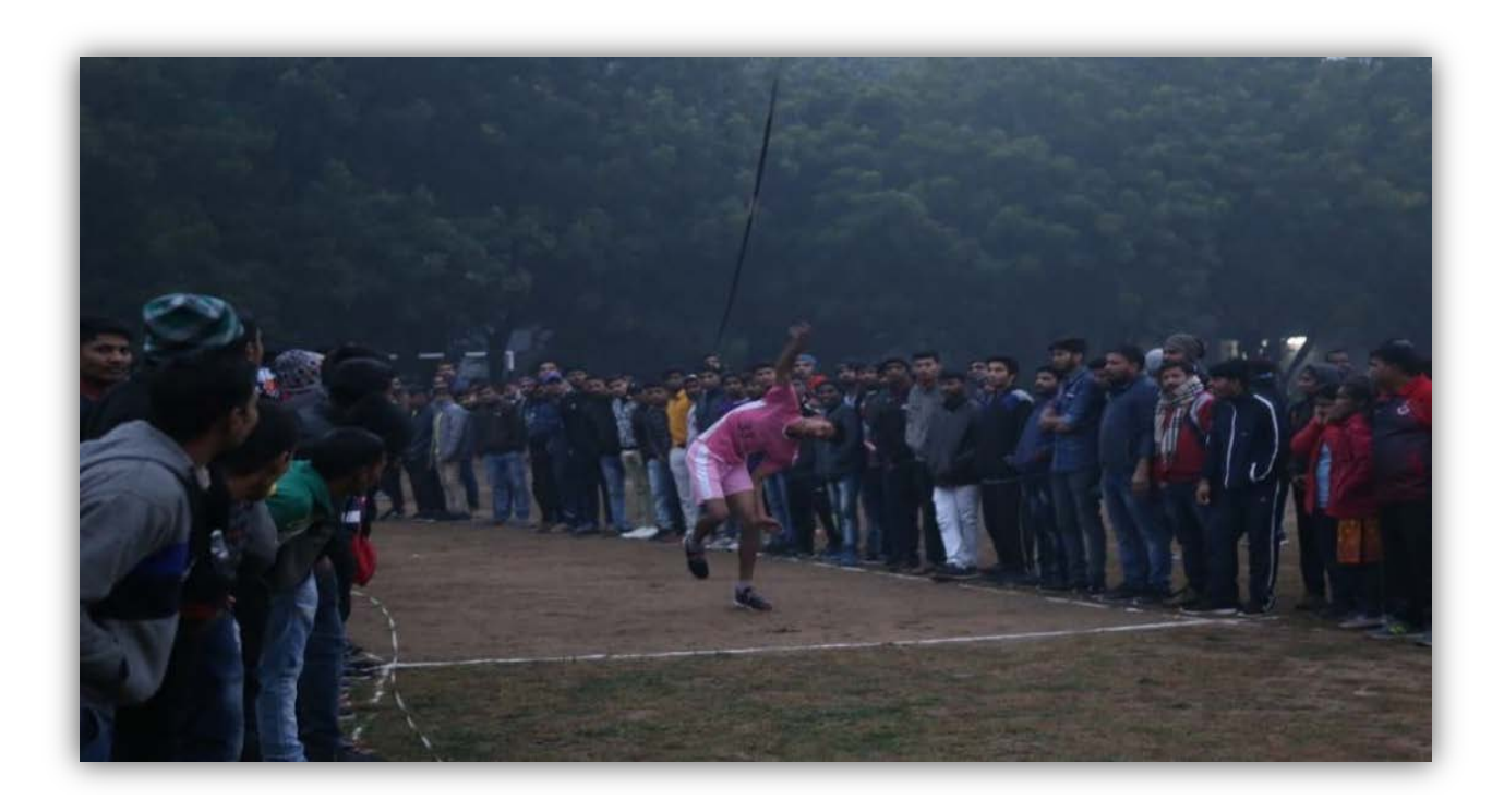
Javelin throw Events College of Agriculture,Khandwa